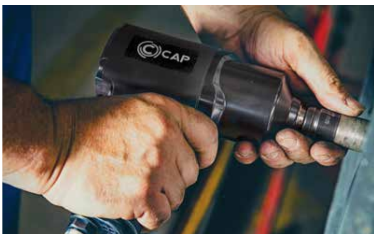
IMPACT WRENCH KP110

INGEGNERIA CIVILE INFRASTRUTTURE CIVIL ENGINEERING INFRASTRUCTURES