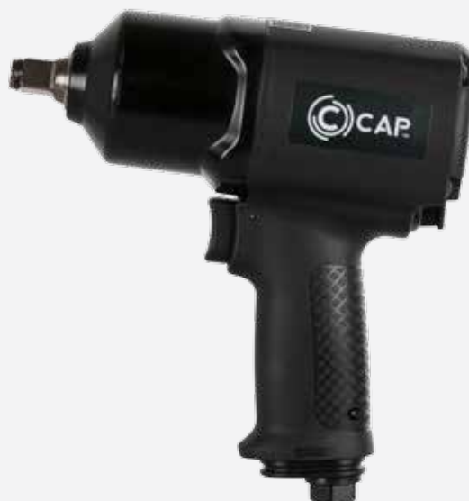
IMPACT WRENCH KP110

1/2" impact wrenches with single hammer (Jumbo) or Twin Hammer mechanism. Ergonomic design and advanced fluid dynamics.