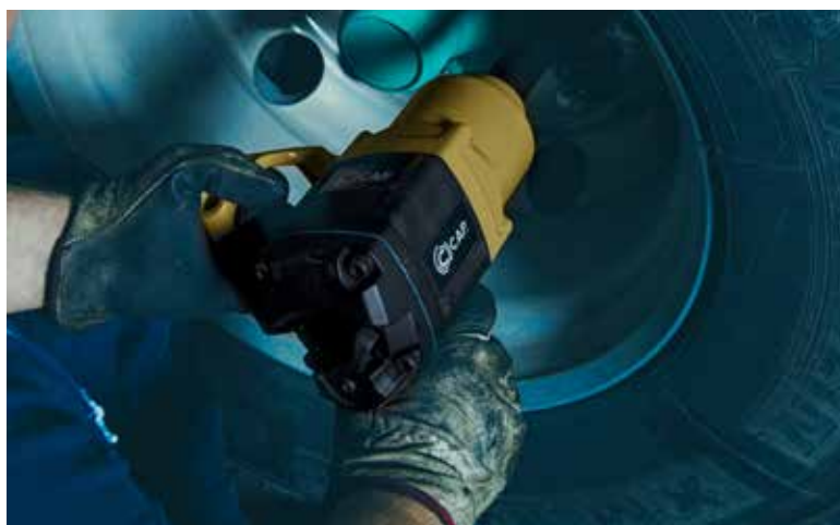
IMPACT WRENCH KP240L