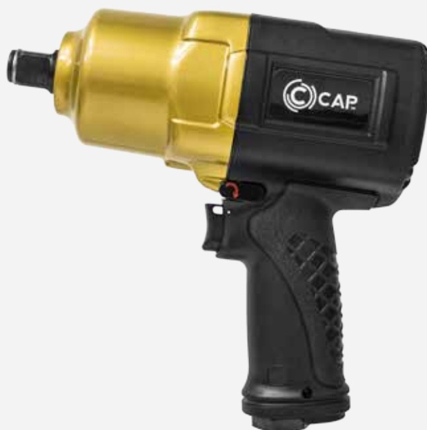
IMPACT WRENCH KP180

3/4" - 1" impact wrenches with Twin Hammer mechanism. Ergonomic design and advanced fluid dynamics.