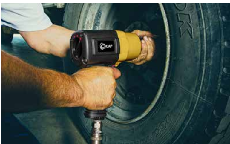
IMPACT WRENCH KP180

INGEGNERIA CIVILE INFRASTRUTTURE CIVIL ENGINEERING INFRASTRUCTURES