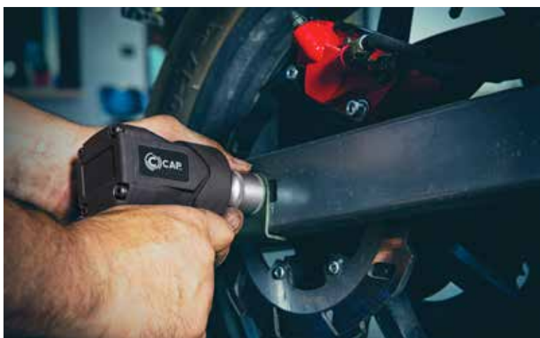
IMPACT WRENCH KP88