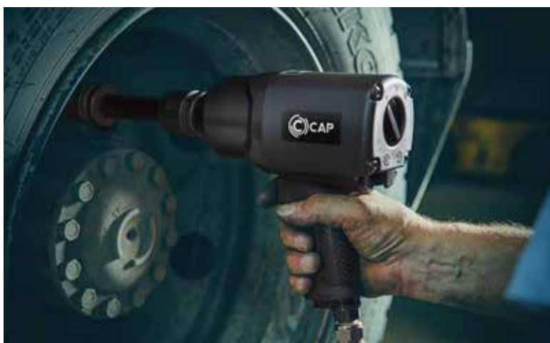
IMPACT WRENCH KP190